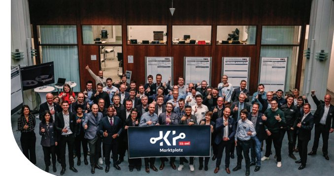
Das Team des KI-Marktplatzes freut sich über einen erfolgreichen Projektstart.

Durch den Einsatz von Künstlicher Intelligenz können die Qualität und Effizienz von Produktentstehungsprozessen deutlich gesteigert werden.